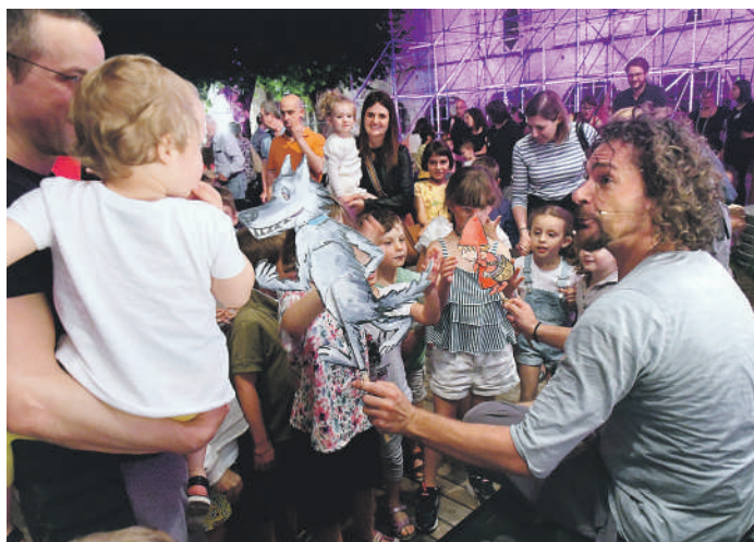
In alto il chiostro trasformato in balera e il teatro per famiglie FOTO DEL PAPA