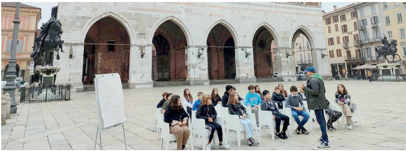
Gli studenti della "Dante-Carducci" nel set allestito in piazza Cavalli