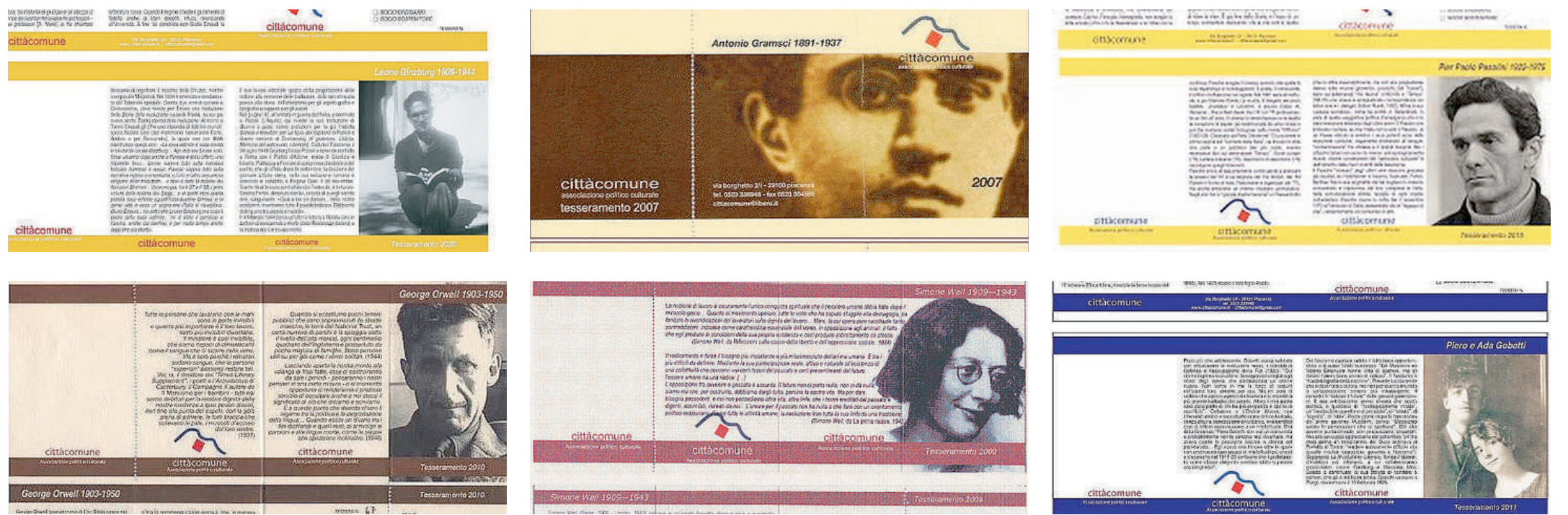
Leone Ginzburg, George Orwell, Antonio Gramsci nel 70° anniversario della morte, Simone Weil, Pier Paolo Pasolini e Piero e Ada Gobetti fra i protagonisti delle tessere di Cittacomune