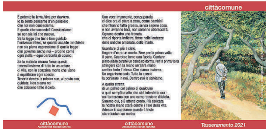
Un quadro di Guttuso per la tessera del 2021 e la poesia di Mariangela Gualtieri

tutt'altro che trascurabili, del pensiero - ha ritrovato uomini e donne conosciuti direttamente, come il poeta Franco Fortini e la scrittrice Elsa Morante. Significativa pure la scelta di includere sulla tessera del 2011, accanto a Piero Gobetti, con la sua rivista "La rivoluzione liberale" una fonte di ispirazione ineludibile, la moglie Ada. Per Bellocchio una forma di giustizia: «Erano una coppia che lavorava insieme. Mi pareva anche giusto farlo». La serata alla Magnana si svolgerà all'aperto, consentendo il rispetto del distanziamento fisico. Fino alla metà di luglio ci si potrà inoltre recare nella sede di via Borghetto 2i, il sabato dalle 10 alle 13 e il giovedì dalle 21 alle 24. Anna Anselmi