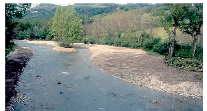
Uno scorcio del Parco dello Stirone

Ogni mercoledì fino al 25 agosto escursioni per grandi e piccini. Animali, piante, arte e cultura