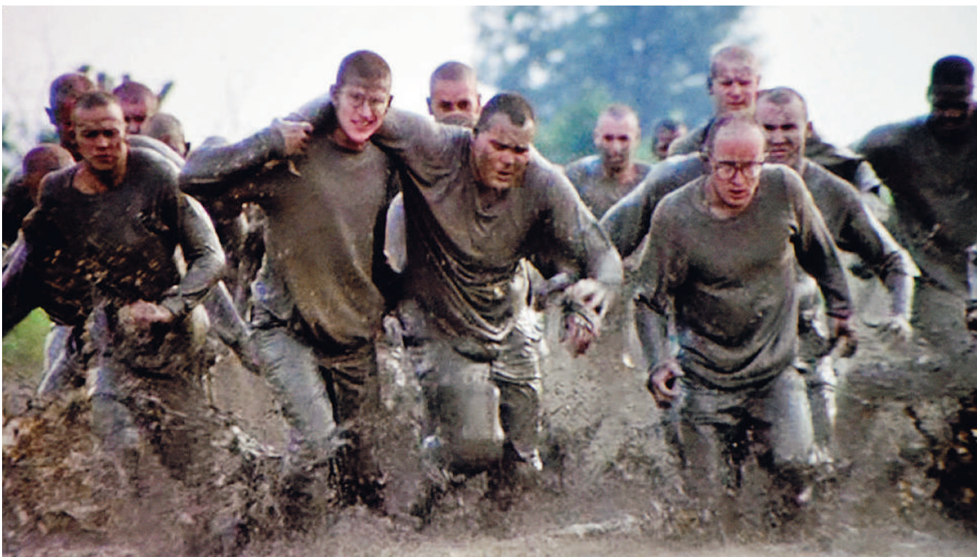
Una scena del film "Full metal jacket" di Stanley Kubrick proiettato all'auditorium della Fondazione di Piacenza e Vigevano FOTO DEL PAPA