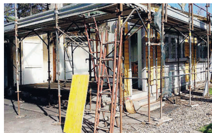
I locali del centro educativo della Casa del Fanciullo distrutti dall'incendio

Dopo il rogo del 2014. Martedì la cerimonia