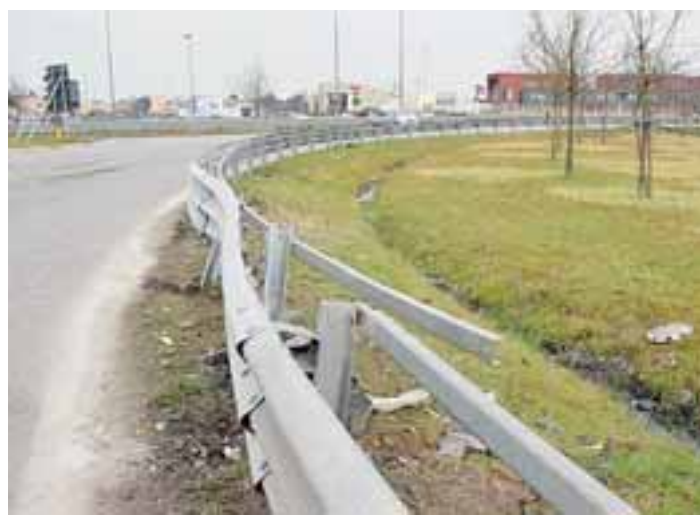
Il guard rail contro cui si è schiantata la Mini inseguita dai carabinieri

Una pattuglia dei carabinieri in servizio nei pressi di Gragnano ha intimato l'alt per un normale controllo ad una Mini Cooper, il cui conducente invece di rallentare e fermarsi ha accelerato improvvisamente evitando la pattuglia che si è subito messa all'inseguimento. La Mini a folle velocità ha raggiunto Campremoldo e poi ha proseguito in direzione di Piacenza tallonata dai militari dell'Arma. Arrivata in strada Agazzana all'altezza della rotatoria di collegamento con l'imbocco della tangenziale sud, la Mini Cooper ha improvvisamente sbandato e il suo conducente ha perduto il controllo del mezzo andando a sbattere contro un guard rail. Il guidatore della macchina è stato subito bloccato e condotto in caserma dai carabinieri. Si tratta di un piacentino ventinovenne che fortunatamente nell'incidente stradale è rimasto illeso. Il giovane aveva bevuto alcolici e ha tentato il tutto per tutto per evitare che gli fosse ritirata la patente ma purtroppo per lui gli è andata male. Sottoposto al test alcolemico è risultato positivo, con 0,8 grammi di alcol per litro di sangue. Aveva quindi bevuto un quantitativo di alcol di poco superiore a quanto consentito dal codice della strada, che pre-