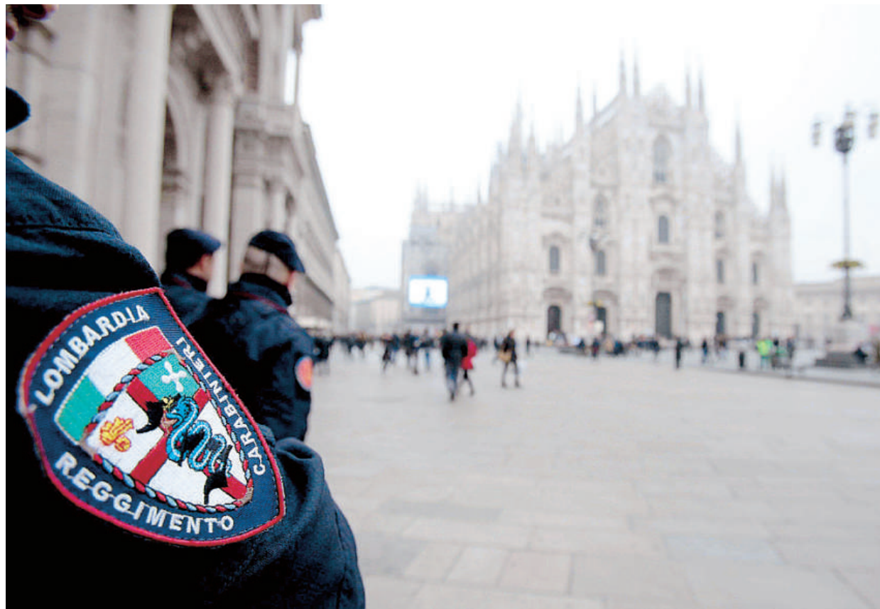
San Pietro a Roma, il Duomo e la Scala a Milano: il livello di allarme terrorismo si alza ai massimi livelli dopo la segnalazione Fbi.

A RISCHIO TERRORISMO ANCHE IL DUOMO E LA SCALA DI MILANO SOTTO SORVEGLIANZA